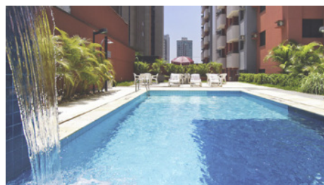
Apart-hotel em São Paulo Em "Informação"