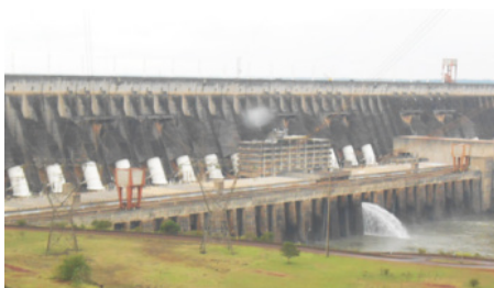
Visita a Usina Binacional de Itaipu Em "viagens"