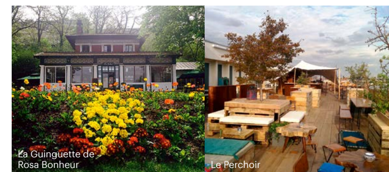
La Guinguette de Rosa Bonheur

La Guinguette de Rosa Bonheur, în parcul Buttes Chaumont, este definiția relaxării pariziene, cu un mix de oameni foarte eclectic. De la designeri recunoscuți până la studenți la Sciences Po, toată lumea se adună sub semnul socializării relaxate pentru un dans și un apéro . În zilele de joi și duminică este practic imposibil să prinzi un loc, dacă nu vîi devreme, chiar dacă ești Tisci. La Rosa nu se fac rezervări și parti-pris -uri. Și toată lumea e OK cu asta. Ador acest loc pentru lipsa de pretenții, pentru atmosfera relaxată și pentru întâlnirile cu oameni foarte interesanți. Și nici mica selecție de amuse-bouches nu e rea, mai ales după două pichet-uri de rosé cu prietenii. În aceeași notă relaxată pariziană young, pot recomanda și Le Perchoir din Oberkampf – bastionul tineretii mele pariziene. Un restaurant cu roof bar , destul de atipic pentru Paris, cu o priveliște ametoitoare asupra orașului.