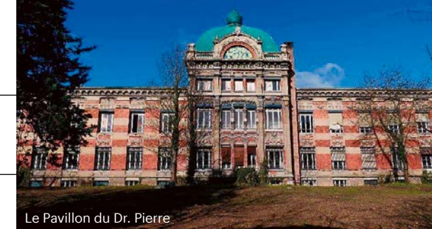
Le Pavillon du Dr. Pierre