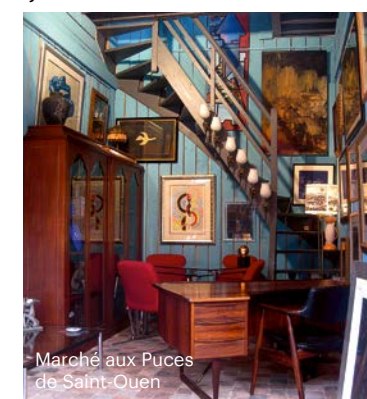
Marché aux Puces de Saint-Ouen

Marché aux Puces de Saint-Ouen, cel mai mare târg de antichități și vechituri din Europa, este unul dintre locurile mele favorite în Paris. Târgul este imens și se întinde pe câteva hectare, la marginea orașului, undeva în apropierea cartierului Montmartre. În interiorul lui sunt sute de magazine care vând aproape tot ce-a fost creat în ultimele decenii și chiar secole. Indiferent dacă vrei o piesă